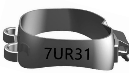
2. Molar mit 1-Tube (UR17, UL27, LL37, LR47), mit Linguallasche/Lingualflügel