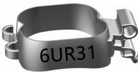
1. Molar mit 3-Tube Kombi (UR16, UR26) mit Linguallasche/Lingualflügel

Des Weiteren finden Sie die Übersicht der enthaltenen Stückzahlen unserer verschiedenen Bänder-Set-Varianten sowie die Bestellscheine für Bänder-Sets und einzelne Bänder.