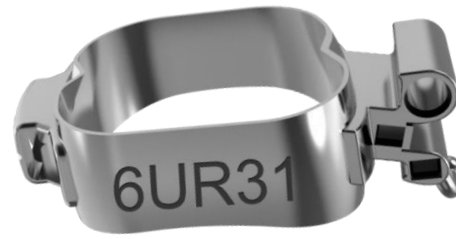
1. Molar mit 3-Tube Kombi (UR16, UR26), wahlweise mit Palatinalschloss