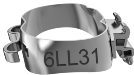
1. Molar mit 2-Tube-Kombi (LL36, LR46) mit Linguallasche/Lingualflügel