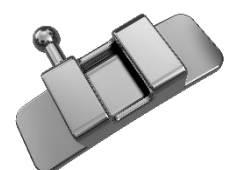
Palatinalschloss mit Häkchen