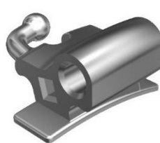
Double Combination Tube